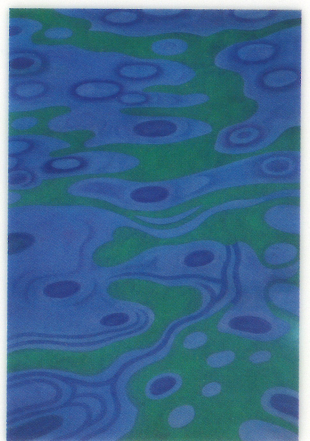
福田平八郎 | Heihachiro Fukuda 《水》 | Water 1958年 | 1958

緑と青の透明フィルムを、同じ大きさの四角や丸で切り抜いて、数枚重ねてみましょう。どのような形や色が現れるのでしょうか？