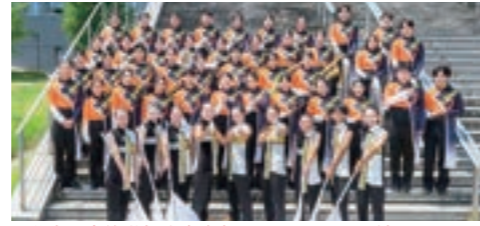
大分東明高等学校吹奏楽部・バントワリング部

東明高校吹奏楽部&バントワリング部と社会人ビッグバンドのミズジャズオーケストラのスペシャルコラボ。OPAM10周年を祝って、商店街を楽しい音楽で彩ります。