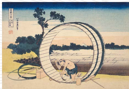
《富嶽三十六景 尾州不見原》葛飾北斎 天保2年~4年(1831~33)頃 (展示期間:8/20(火)~9/8(日))