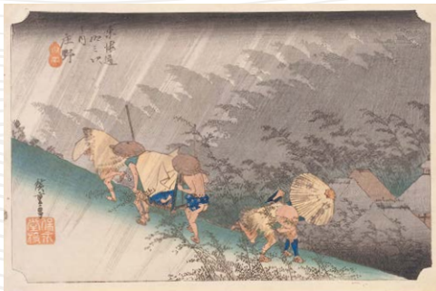
《東海道五拾三次之内 庄野 白雨》歌川広重 天保5~7年(1834~36)頃 (展示期間:8/20(火)~9/8(日))