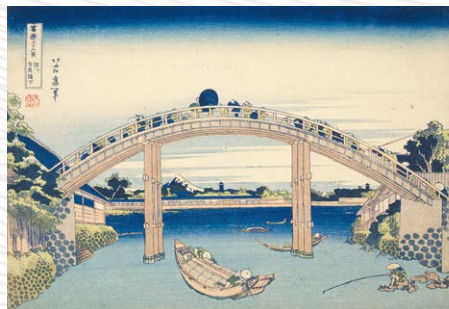
《富嶽三十六景 深川万年橋下》葛飾北斎 天保2年~4年(1831~33)頃 (展示期間:7/26(金)~8/18(日))