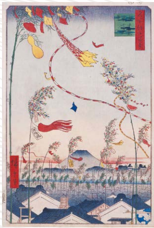
《名所江戸百景 市中繁栄七夕祭 歌川広重 安政4年(1857)》 (展示期間:7/26(金)~8/18(日))