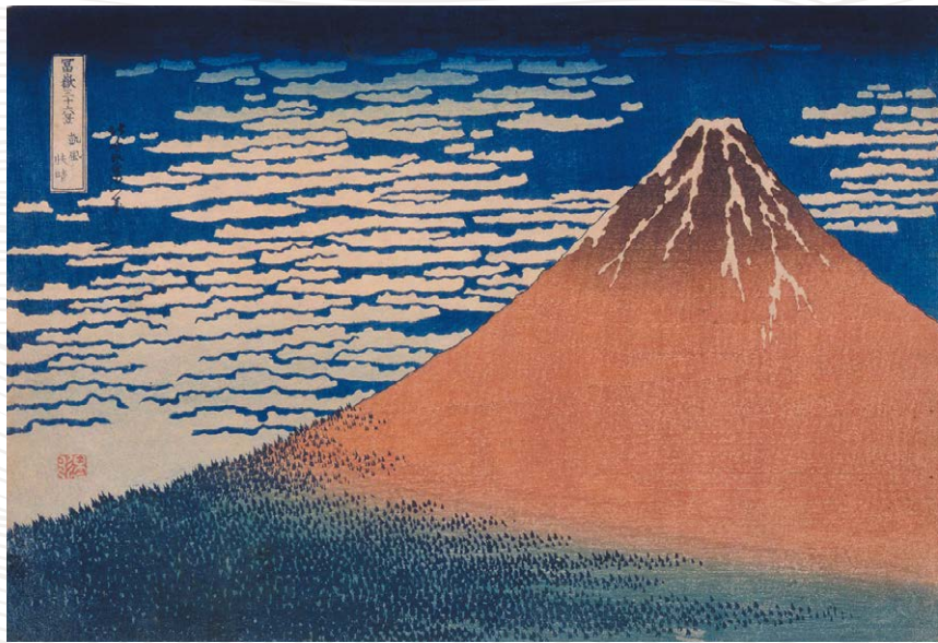
《富嶽三十六景 凱風快晴》葛飾北斎 天保2年~4年(1831~33)頃(展示期間:8/13(火)~9/2(月))