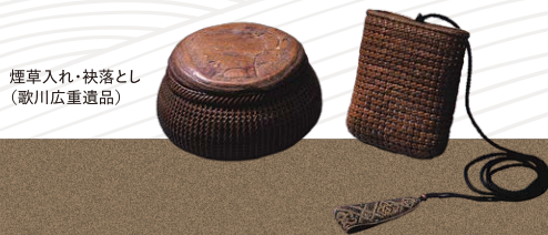
煙草入れ・袂落とし (歌川広重遺品)

本展では、風景版画で双璧をなす葛飾北斎(1760~1849)と歌川広重(1797~1858)、二人それぞれの風景画への「挑戦」に焦点を当て、名作「富嶽三十六景」、「東海道五拾三次之内」などの代表作を中心に紹介します。「富嶽三十六景」は前後期で全46図大公開!(会期中、大規模な展示替えを行います)今回東京都江戸東京博物館の貴重な浮世絵コレクションを、九州では大分でのみご覧いただけます。ぜひお見逃しなく!