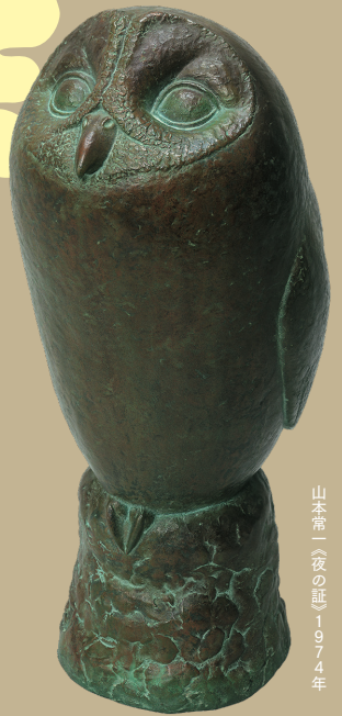
山本滯一《夜の証》1974年