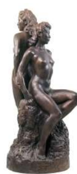
朝倉文夫 《姉妹》（1947年）大分県立美術館蔵