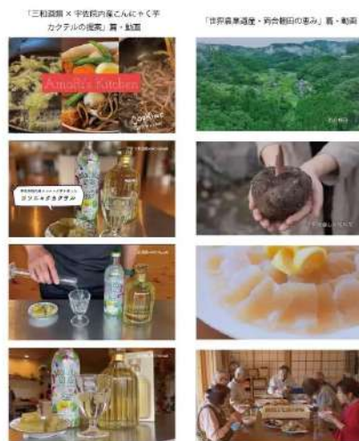
国東半島宇佐地域世界農業遺産

「食を通じて、世界農業遺産を伝える 未来につなげる地域の魅力発信プロジェクト」 (企画・プロモーション)