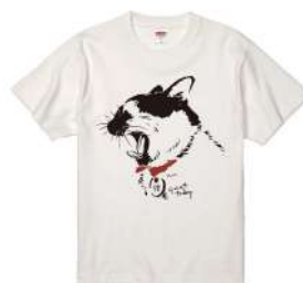
商品名：ななはちオリジナルシャツ (AZUKI)