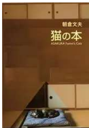
商品名：『朝倉文夫 猫の本』