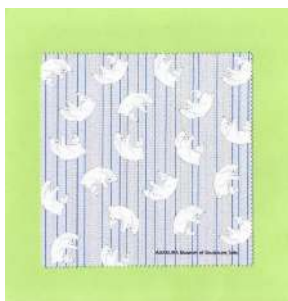
商品名：めがねふき