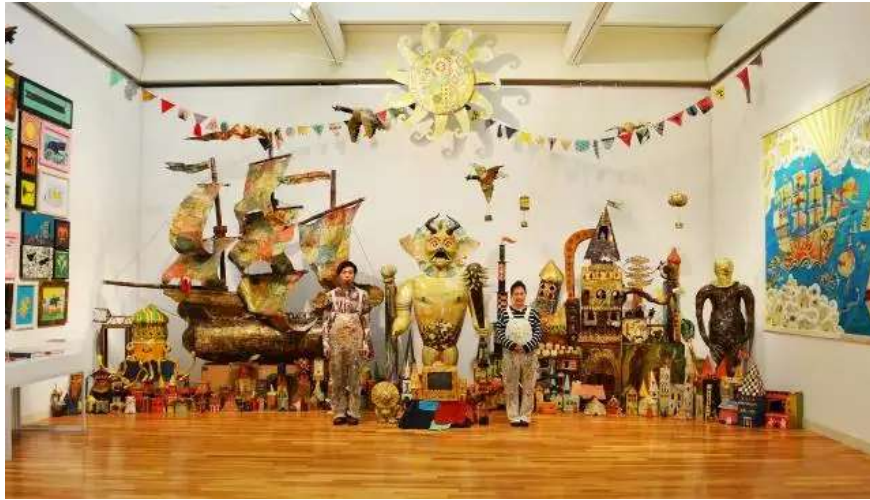
「CIAO！“進世代”の胎動」会場風景 2016年（大分市美術館）