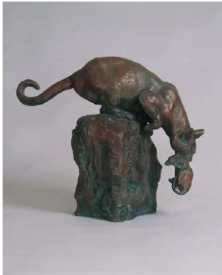
朝倉文夫 《よく獲たり》（1946年）大分県立美術館蔵