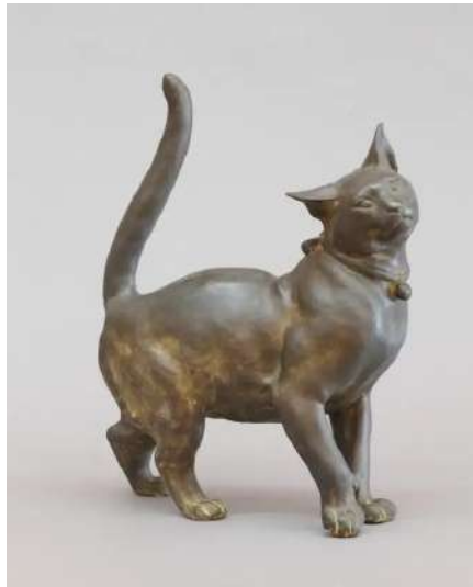
朝倉文夫 《たま（好日）》（1930年）朝倉文夫記念館蔵