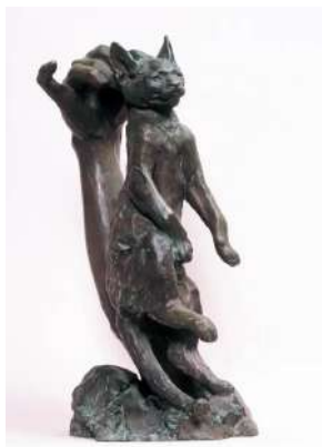
朝倉文夫 《吊された猫》（1909年） 大分県立美術館蔵