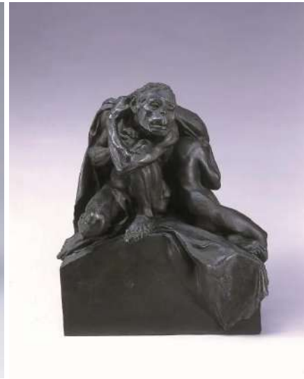
朝倉文夫 《進化》（1907年）台東区立朝倉彫塑館蔵