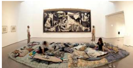
こども+おとな+夏の美術館2009「まいにち!アート!」展示風景