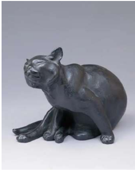
朝倉文夫 《はるか》（1918年頃）台東区立朝倉彫塑館蔵