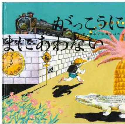
絵本「がっこうにまにあわない」2022年（あかね書房）