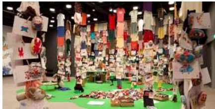
安部泰輔「ふたご森」会場風景