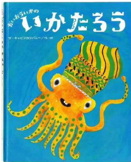
絵本「だいのういかのいかたろう」2014年（鈴木出版）