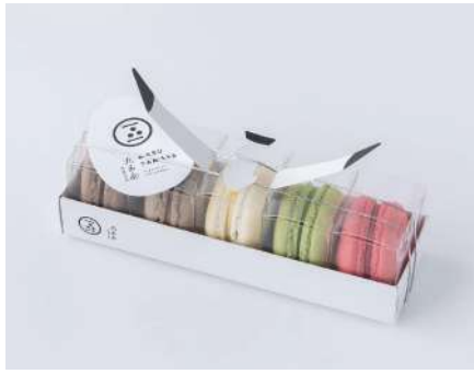
丸玉屋菓子店パッケージ