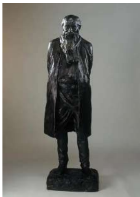
朝倉文夫 《墓守》（1910年）大分県立美術館蔵