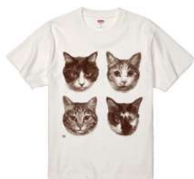
商品名：ななはちオリジナルシャツ (猫街ろまん)