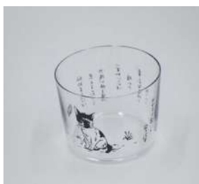
商品名：ななはちオリジナルグラス