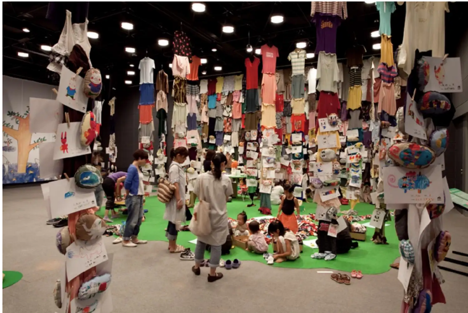
安部泰輔 「ふたご森」会場風景 (夏のワークショッププロジェクト、2010「ふしぎの森の美術館」、広島市現代美術館、2010年)