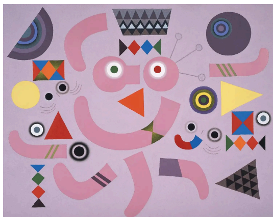
宇治山哲平 《歓》 1975年