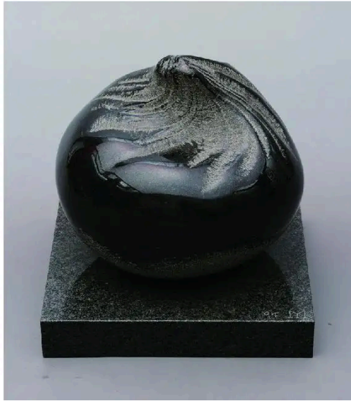
吉村益信《なぜか茶巾しほり》1994年