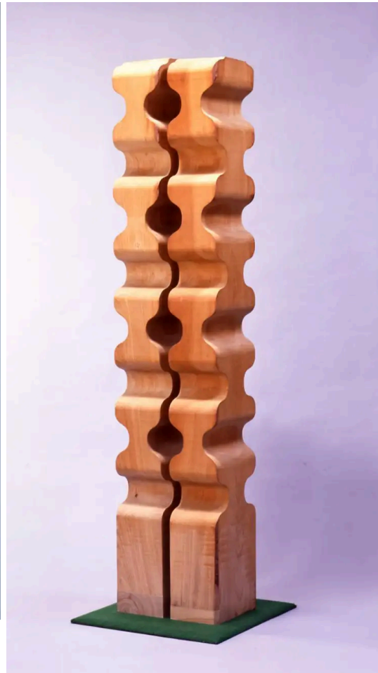
宮崎準之助《立つものの様態》1976年