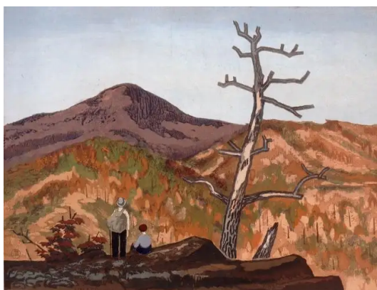
武田由平 《秋晴れ》 (寄託品) 1942年