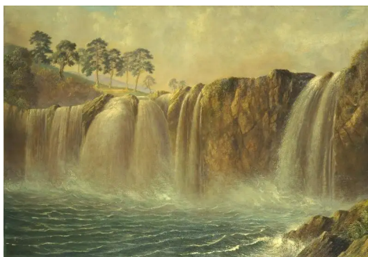
諫山麗吉 《沈墮之瀧》 1901年