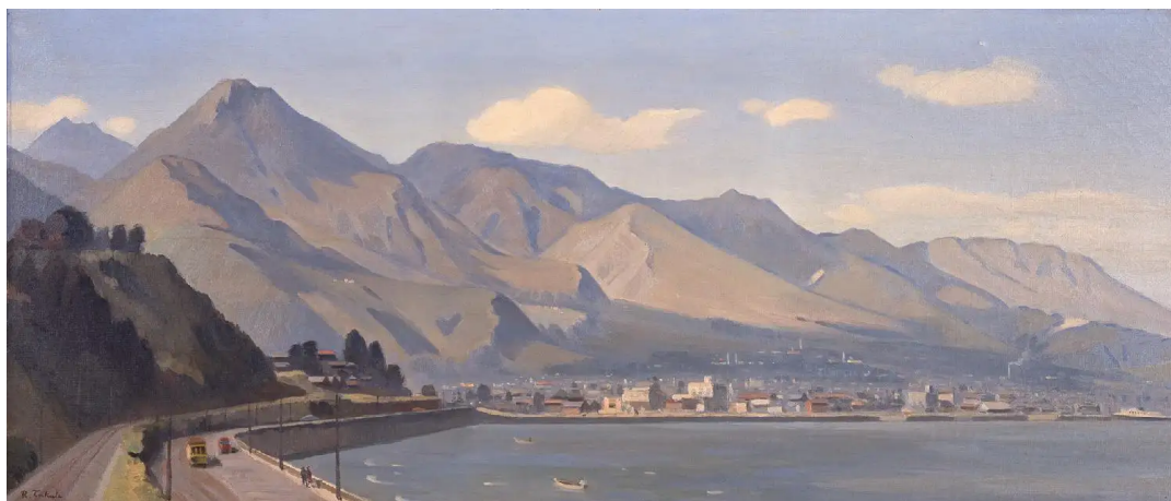
高田力蔵 《別府大観》 1953年