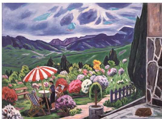
後藤真吉 《城島風景》 制作年不詳